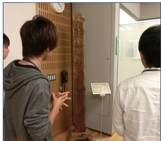
北方資料館に展示されている「大日本 地名アトイヤ」の標柱レプリカ（択捉 島に仙台藩士が再建したもの）