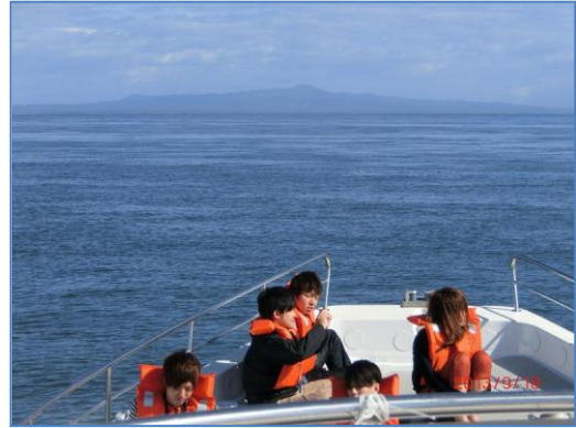
国後島が近づいてきます