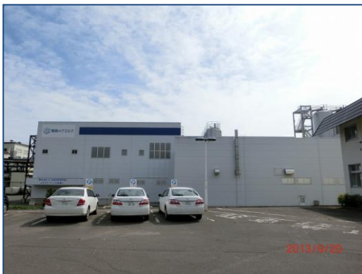
雪印メグミルクなかしべつ工場