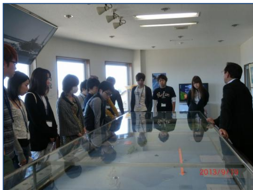
北方館小田嶋館長から説明を受けます