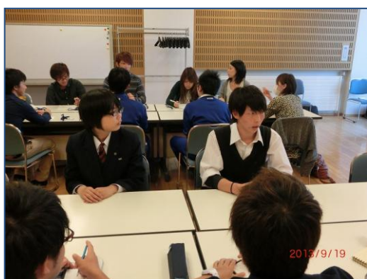
地元高校生との意見交換 (根室西高校)