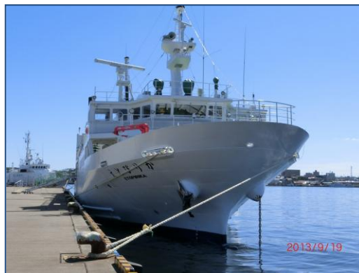
根室港に停泊するえとぴりか