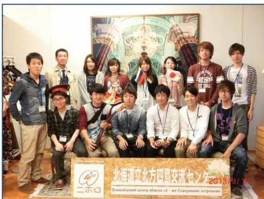
ニ・ホ・ロのロシアルームで 記念撮影