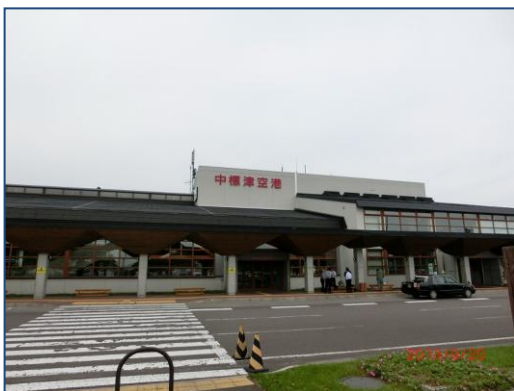
いよいよ帰路に着くことに