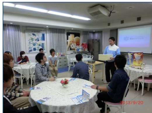
チーズ製造工程の説明