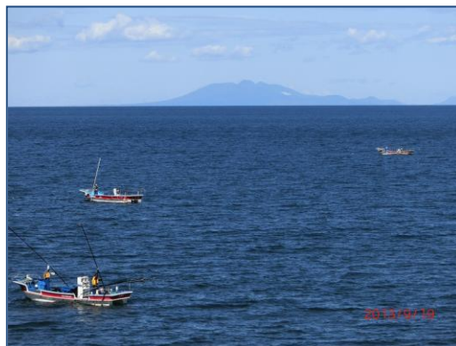
昆布漁の船と国後島