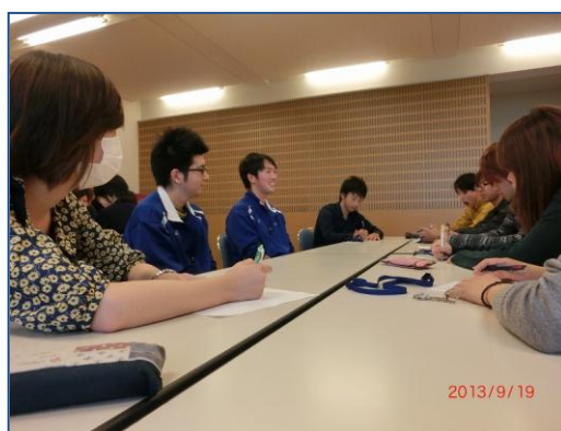
地元高校性との意見交換 (根室高校)