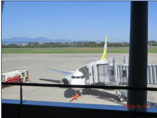
いよいよ出発です!!