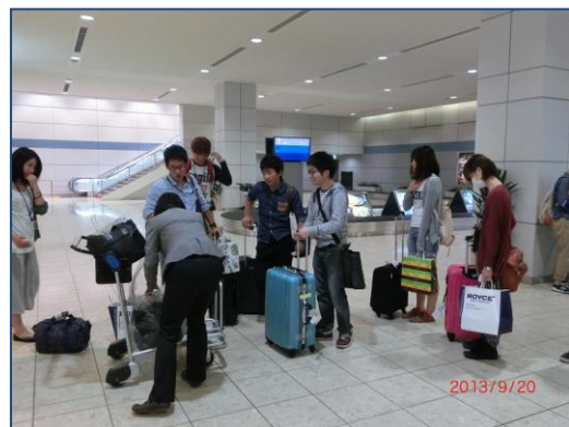
無事に仙台空港到着