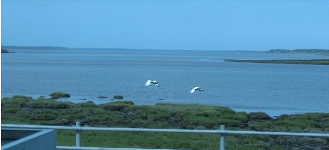
温根沼で遭遇したタンチョウ