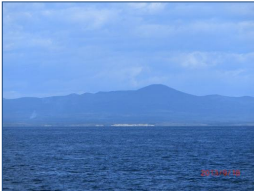
間近に見える国後島