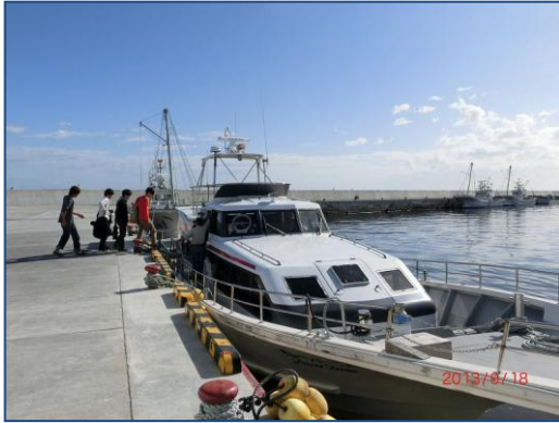
国後島クルーズに出発