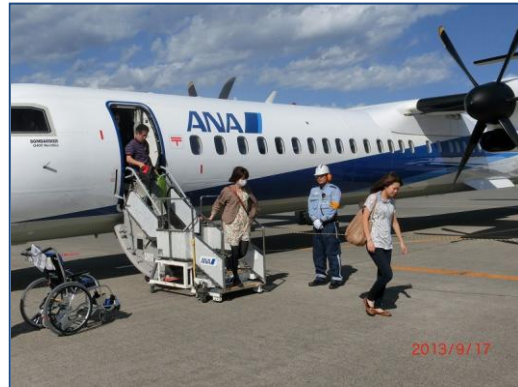
中標津空港に到着